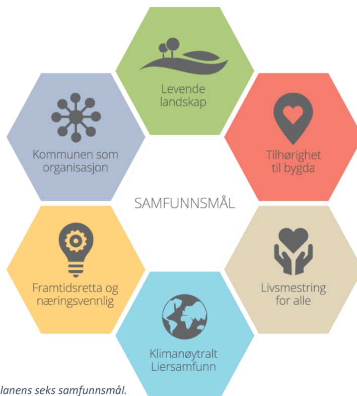
Figur 3: Kommuneplanens seks samfunnsmål.

Arealdelen angir hovedtrekkene i kommunens arealdisponering, og gir rammer og betingelser for arealbruk som kan settes i verk. Her vises sammenhengen mellom ønsket samfunnsutvikling og kommunens arealbruk. Framtidig arealbruk har vesentlig betydning for kommunens sosiale, miljømessige og økonomiske utvikling. En langsiktig arealstrategi er lagt inn, og er det vesentligste bindeleddet mellom kommuneplanens samfunnsdel og arealdel.