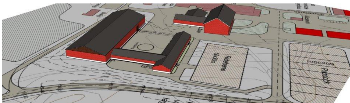
Bilde 1 tegning over stall og rideanlegg på Rosthaug vgs avdeling Buskerud.